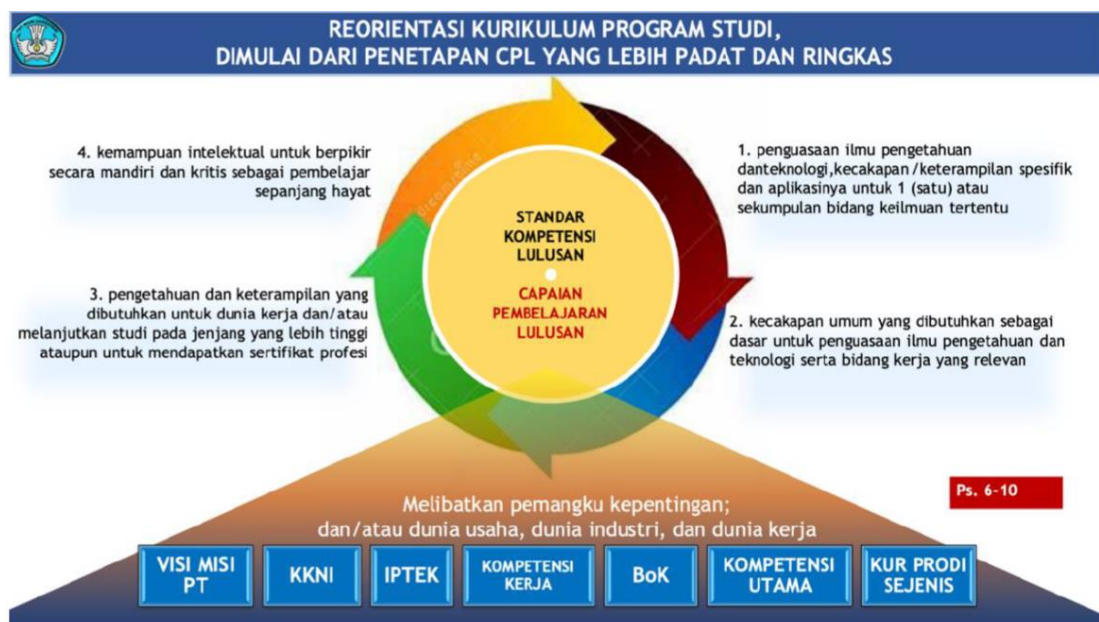
Gambar 2. Capaian Pembelajaran Lulusan

Berdasarkan Permendikbudristek No. 53 Tahun 2023 tentang Penjaminan Mutu Pendidikan Tinggi bahwa reorientasi kurikulum perguruan tinggi dimulai dari penetapan Capaian Pembelajaran Lulusan yang lebih padat dan ringkas. Berdasarkan pasal 6, 7 dan 8 seperti terlihat pada Gambar 2.